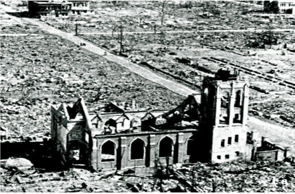
अणुबाँबच्या हल्ल्यात उध्वस्त झालेले हिरोशिमा.

पारंपरिक पद्धतीने युद्ध जिंकणे यात दोन्ही बाजूंची मनुष्यहानी पाच ते दहा लाखांपर्यंत होईल असा अंदाज अमेरिकेतील युद्धशास्त्रातील तज्ज्ञ मंडळींनी मांडला. तत्कालीन