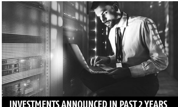
INVESTMENTS ANNOUNCED IN PAST 2 YEARS

"Data storage in India has grown eight times to 2.8 zettabytes since 2014, driven by rapid adoption of Cloud, growth in digital transactions and e-commerce," said B S Rao, vice-president (market-