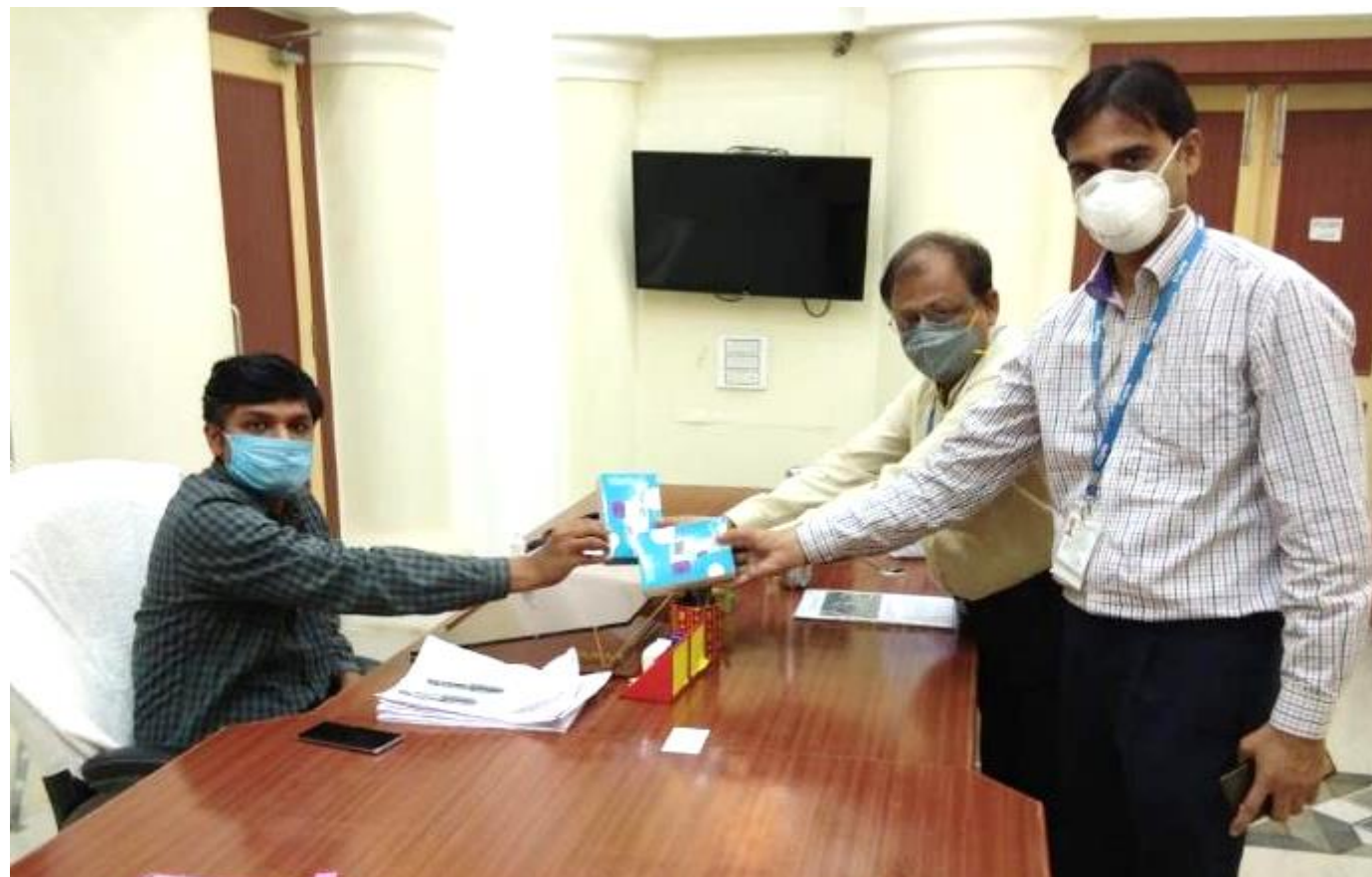
Support to District Administration with PPE, Mask & Thermometer for frontline health workers