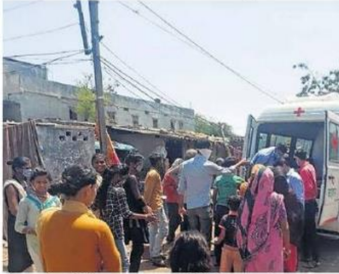
पीथमपुर. भोजन पैकेटों का नपा द्वारा जरूरतमंदों को किया जा रहा वितरण।

इसी प्रकार शाम के समय महिंद्रा टू व्हीलर ने 500 पैकेट, प्रतिभा सिस्टिक्स ने 500 पैकेट, सिप्ला फार्मास्यूटिकल ने 200 पैकेट, प्लेक्सोइट इंटरनेशनल ने 100 पैकेट, एसआरएफ फिल्म एंड