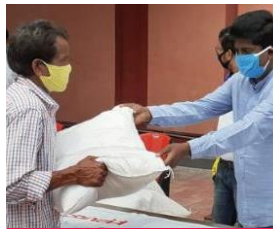
Rice for migrant workers