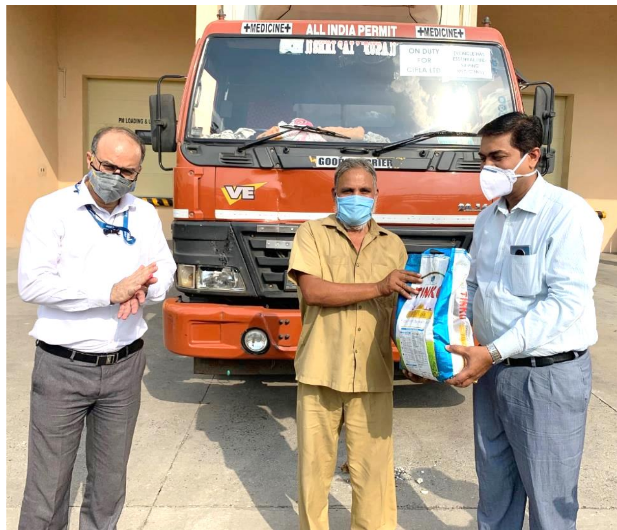
Dry Ration Support to Long Distance Truckers

Dry Ration to truck drivers who supply essential items and medicines to Cipla Manufacturing sites – Kits were handed over to 80 long distance truck drivers as dhabas close due to the lockdown leaving them stranded with no food.