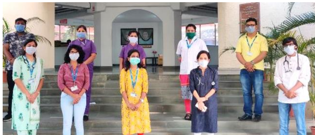
Cipla Palliative Care & Training Centre's team continues to serve patients & families