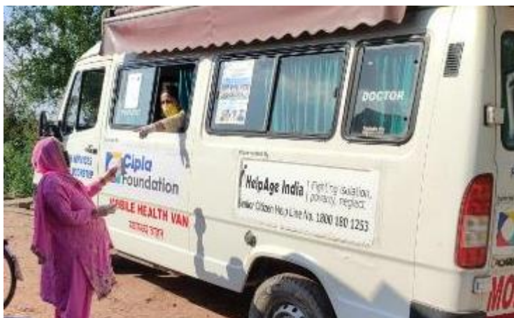
Mobile Healthcare Units reach remote locations