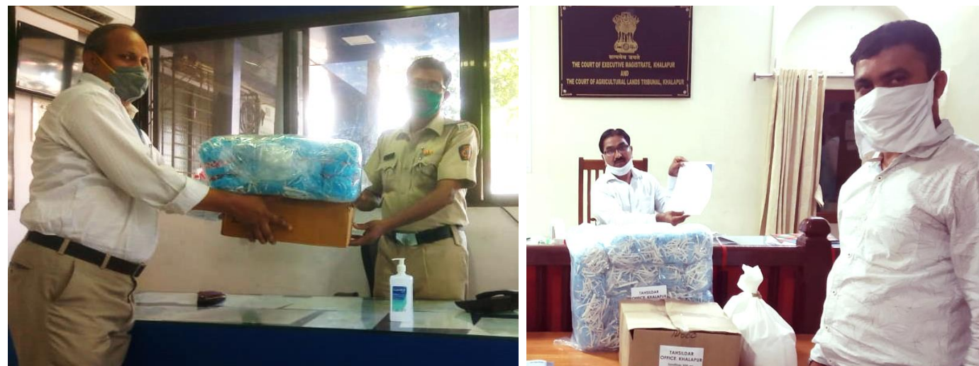
Support to local administration