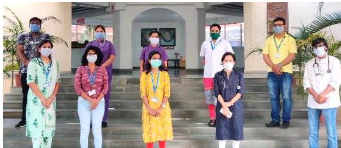
Cipla Palliative Care & Training Centre's stands strong