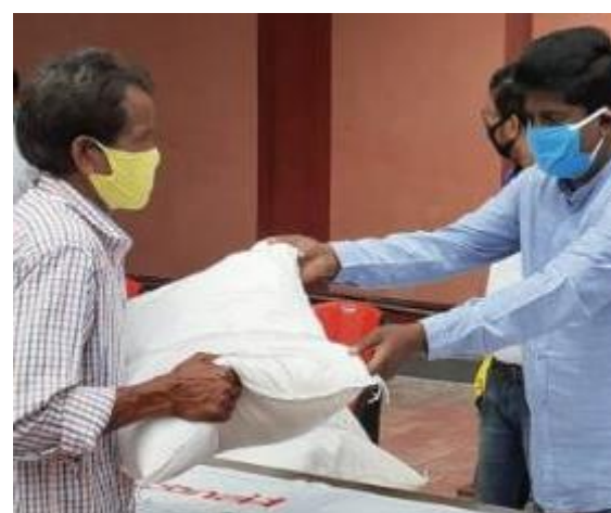
Rice for migrant workers