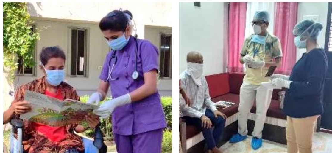
Caring for patients at the Centre and at their homes