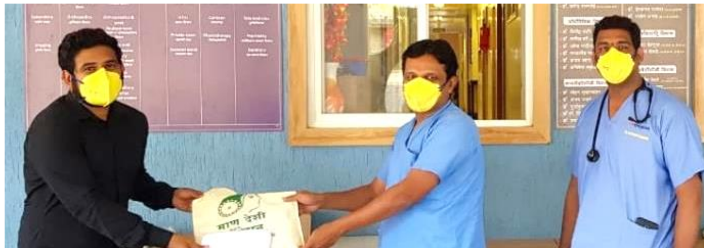
Safety Gear for frontline health workers