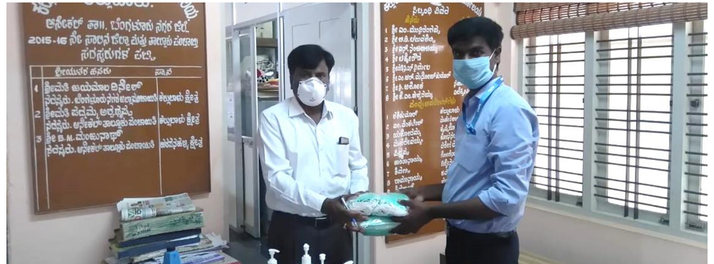
Masks and Sanitizers to Panchayat