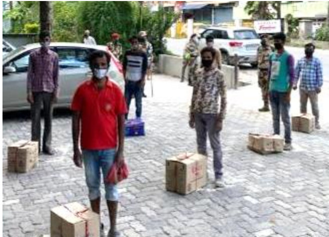
Daily essentials for those in need