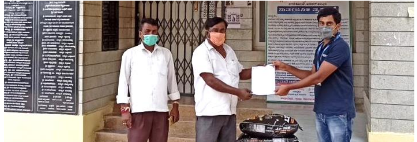
75 Rice Bags for people in remote communities through panchayat