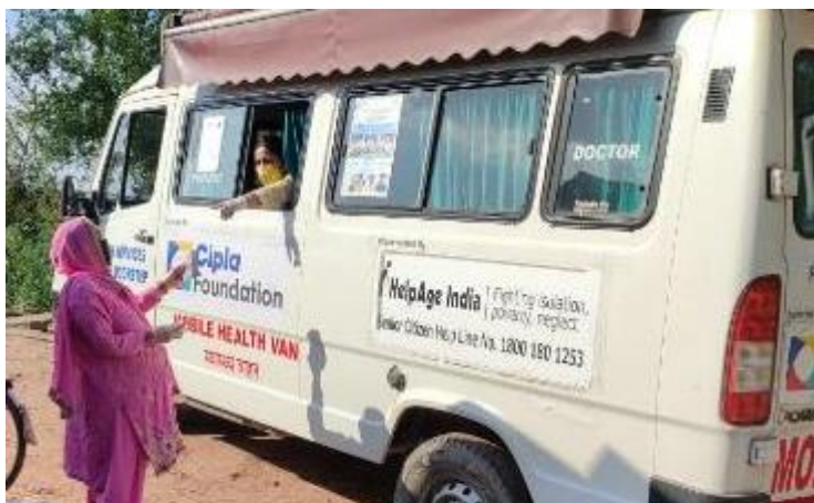
Mobile Healthcare Units reach remote locations