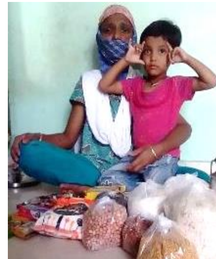
Ration for families