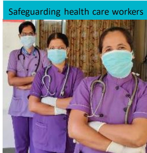
Safeguarding health care workers