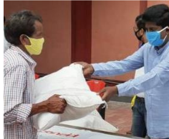
Rice for migrant workers