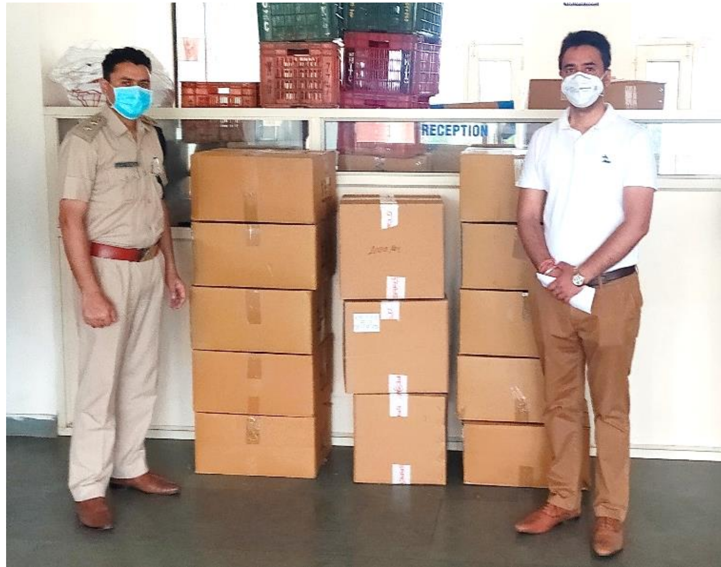
Safety Gears and Sanitizers for frontline health workers