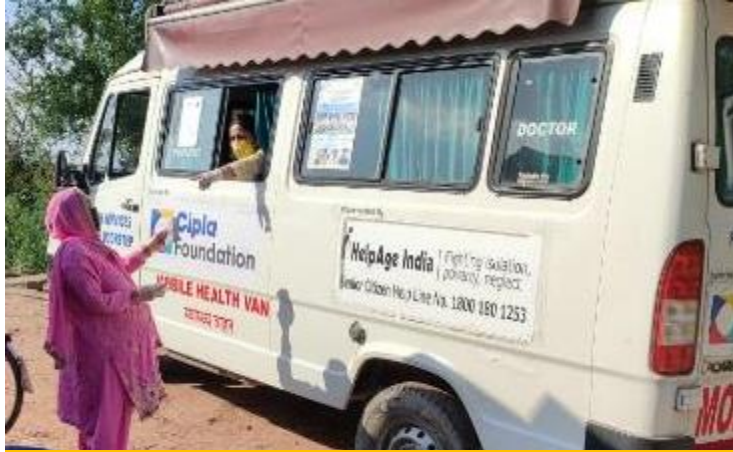
Mobile Healthcare Units reach remote locations