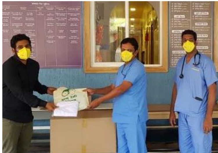
Safety gear for frontline doctors & paramedics