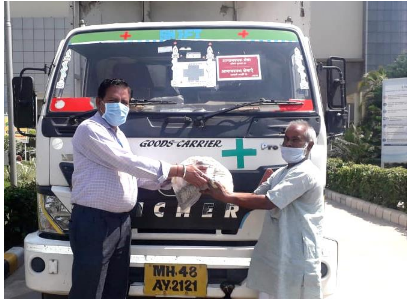
Dry Ration Support to Long Distance Truckers

Dry Ration to truck drivers who supply essential items and medicines to Cipla Manufacturing sites – Kits were handed over to 15 long distance truck drivers as dhabas close due to the lockdown leaving them stranded with no food.