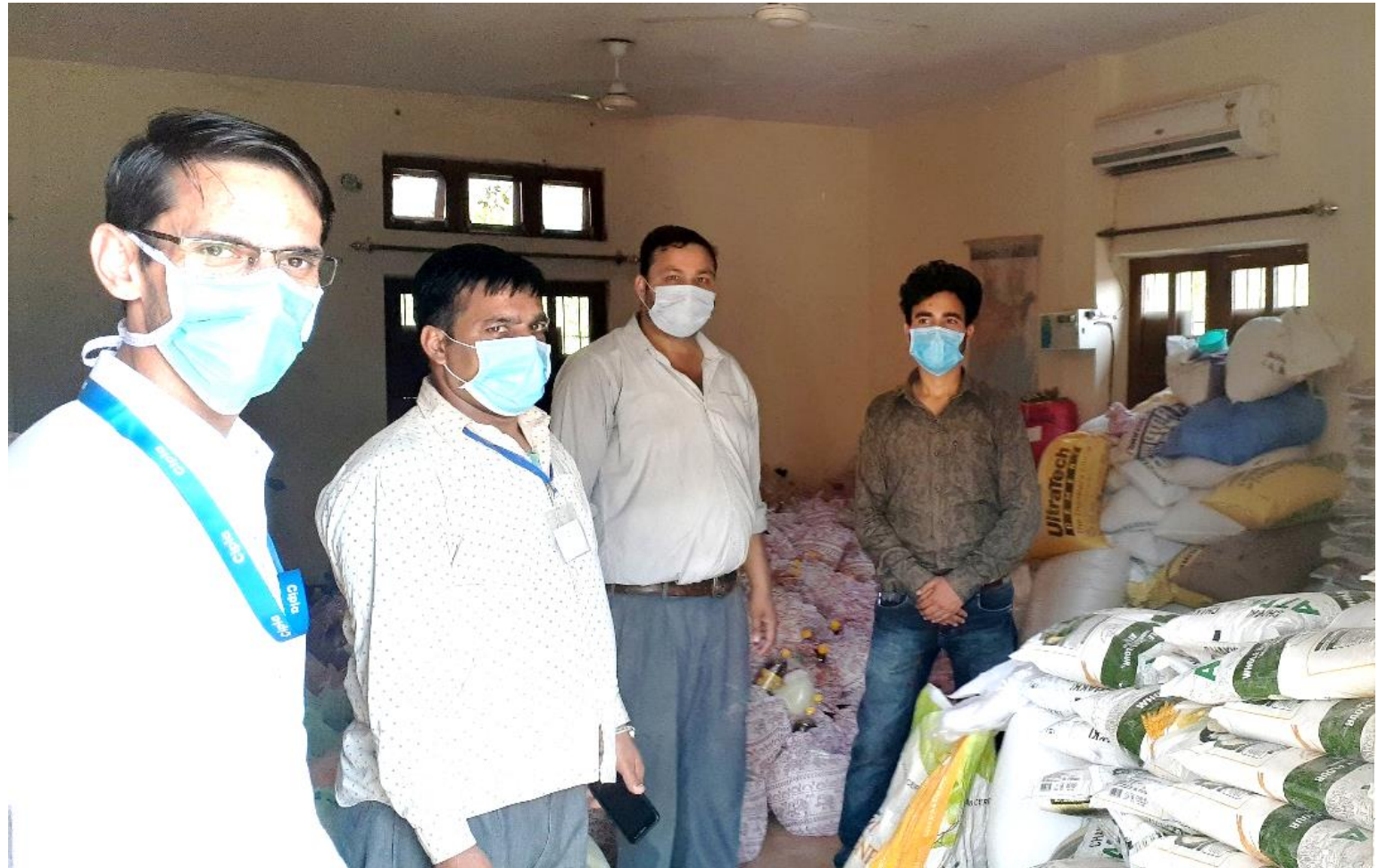
Dry Ration to support local administration

Supporting administration with transportation facility 55 workers from other states sent to their native places