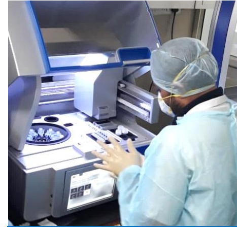
24/7 Covid testing laboratory