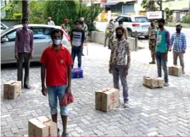
Daily essentials for those in need