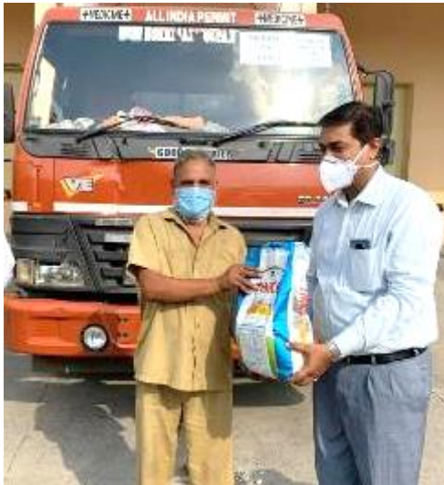
Food supplies for Truckers

Safeguarding Doctors, Frontline Health Workers, Local District Administration with Masks, PPE Kits, Sanitizers