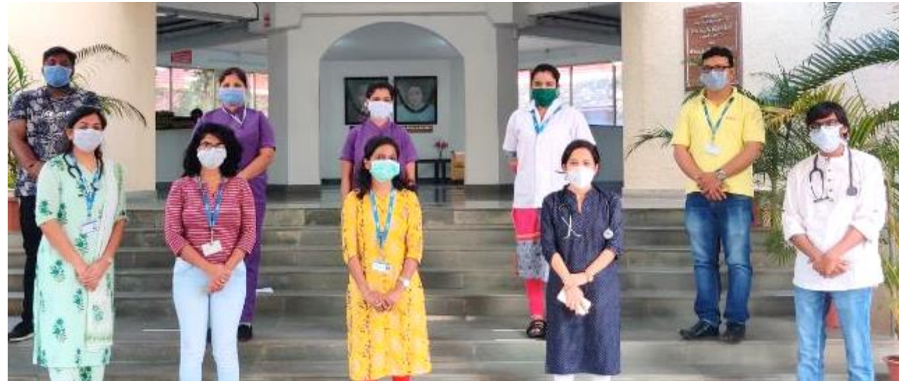
Cipla Palliative Care & Training Centre's team continues to serve patients & families