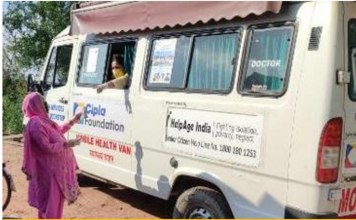
Mobile Healthcare Units reach remote locations