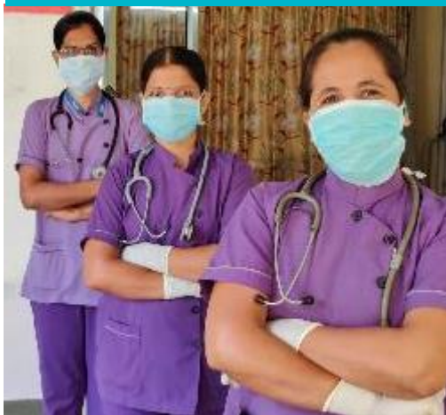
Safeguarding health care workers