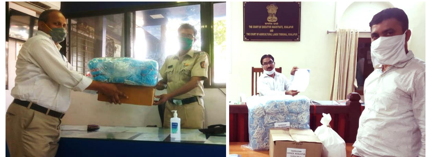
Support to local administration