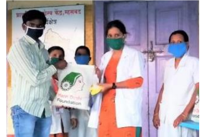
1000 PPEs distributed