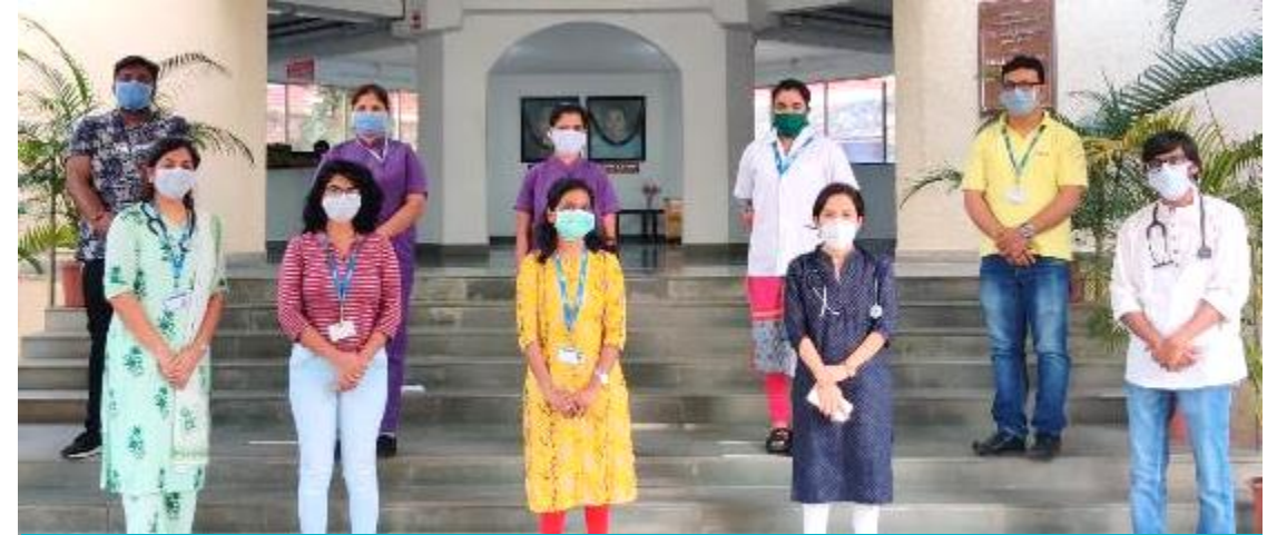
Cipla Palliative Care & Training Centre's stands strong