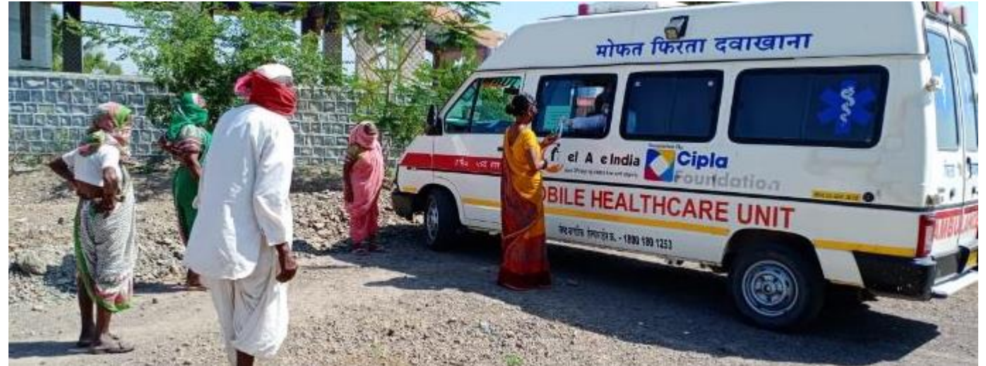
1640+ chronic patients received medicines through Mobile Healthcare Units