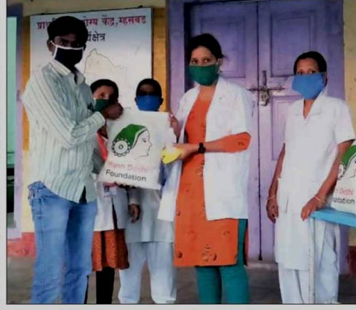
रुग्णांची काळजी लि. साताया वित्त व्यवसाय कार्यालय

साता/प्रतिनिधी : मेडिसि लॅबोरेटरी प्रा. लि. आणि मेडिसि स्पेशलिटी लि. या सिप्ला लिमिटेडच्या उपकंपनीने आज साता-यामधील कोविड-१९ महामारीचा सामना करण्यासाठी हाती घेतलेल्या अनेक उपक्रमांची घोषणा केली. कंपनीने नुकतेच संकटाचा सामना करण्यासाठी देशाला आवश्यक असलेल्या विविध त्वरित व दीर्घकालीन बचावकार्यासाठी २५ कोटी रुपयांचा 'केअरिंग फॉर लाइफ' कोविड-१९ समर्पित फंड उभारला. साता-यामध्ये कंपनी सरकारच्या कोविड व्यवस्थापन प्रयत्नांना साहाय्य करण्या साठी स्थाणिक प्रशासनासोबत सहयोगाने काम करत आहे. सिप्लाचे उपक्रम प्रामुख्याने त्यांचे कर्मचारी, विक्रेते व कंत्राटदार कर्मचारी, प्रत्यक्ष आघाडीवर काम करणारे प्रशासन व आरोग्यसेवा कर्मचारी, तसेच मूलभूत गरजा कमी प्रमाणात उपलब्ध होणा-