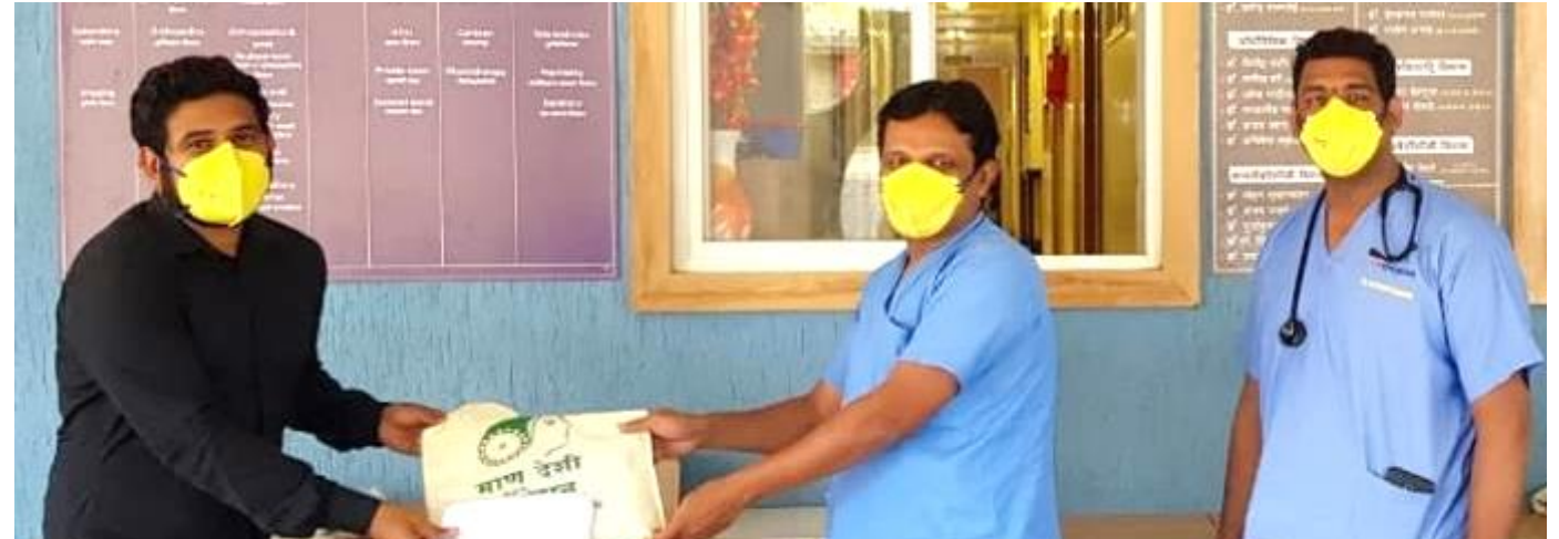
Safety Gear for frontline health workers