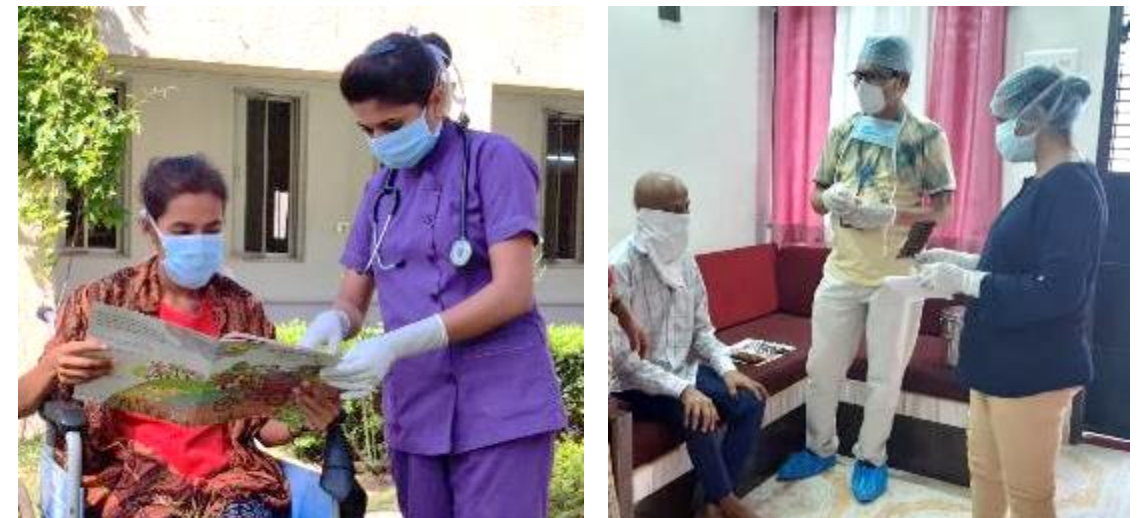
Caring for patients at the Centre and at their homes