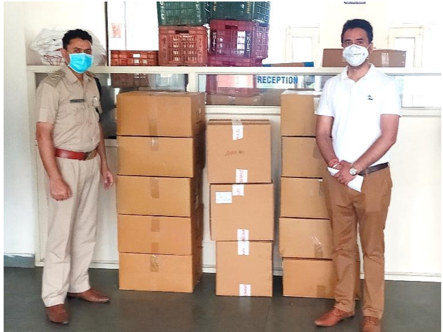
Safety Gears and Sanitizers for frontline health workers