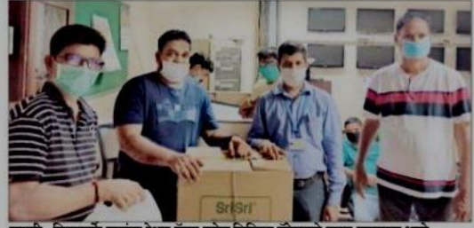
पणजी : सिप्लातर्फे गरजंना रेशन पॅक्स तसेच बिस्किट पॅकेटसचे वाटप करण्यात आले.

कर्मचारी रुग्णांच्या हितासाठी सिप्ता गोवा येथे काम करत आहेत. सिप्ता गोवाने सोशल डिस्टिन्संग व संसर्ग नियंत्रणासाठी सरकारने निर्धारित कैजेल्या नियमांचे पातन होत असल्याची खात्री पेण्याकरिता स्पेशल कोतिड-१९ टास्त्रफोर्स तयार केली आहे. सिप्ता टीमुसच्या हितासाठी कंप्रनी