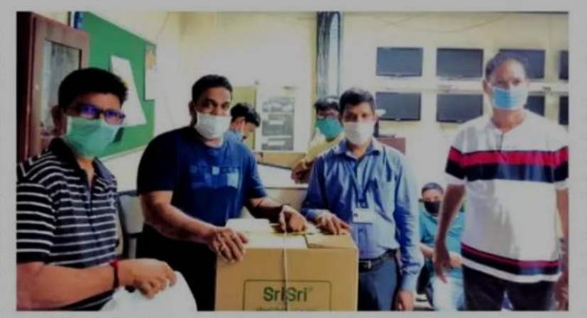
सिप्ला लिमिटेड कंपनीचे अधिकारी उपक्रमाची घोष्टाणा करपा वेळार.

पणजी: सिप्ला लिमिटेड कंपनीन गोंयांत कोवीड-19 म्हामारीक तोंड दिवपा खातीर हातांत घेतिल्ल्या विवीध उपक्रमांची घोशणा केल्या, कंपनीन हालींच ह्या संकश्टा कडेन दोन हात करपा खातीर देशाक गरजेच्या आशिल्ल्या विवीध ताकतिकेच्या आनी दीर्घकालीन बचाव कार्या खातीर 25 कोटी रुपयांची केअरिंग फॉर लायफ कोवीड-19 समर्पीत फंड उबो केला. गोंयांत कंपनीन सरकाराच्या कोवीड-19 वेवस्थापन प्रयत्नांक मजत करपा खातीर थळाव्या प्रशासना बरोबर काम करपाक सरवात केल्या सिप्लाचे उपक्रम मुखेल करून तांचे कर्मचारी, विक्रेते कंत्राटदार कर्मचारी, प्रत्यक्ष आघाडेर काम करपी प्रशासन आनी भलायकी सेवा कर्मचारी तशेंच मुळाव्यो गरजो उण्या प्रमाणांत उपलब्ध जावपी समुदायाच्या व्यक्तींचेर लक्ष केंद्रीत