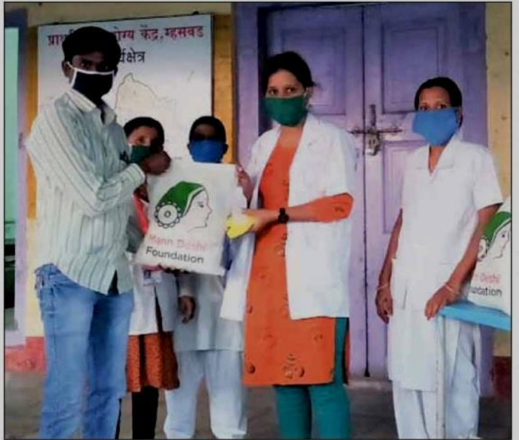
रूग्णांची काळजी सर्व आव्हाने असताना देखील मेडिस्प्रे लॅबोरेटरीज प्रा. लि. आणि मेडिटॅब स्पेशालिटी

साता-यामध्ये कंपनी सरकारच्या कोविड व्यवस्थापन प्रयत्नांना साह्य करण्यासाठी स्थानिक प्रशासनासोबत सहयोगाने काम करत आहे. सिप्लाचे उपक्रम प्रामुख्याने त्यांचे कर्मचारी, विक्रेते व कंत्राटदार कर्मचारी, प्रत्यक्ष आघाडीवर काम करणारे प्रशासन व आरोग्यसेवा कर्मचारी, तसेच मूलभूत गरजा कमी प्रमाणात उपलब्ध होणा-या समुदायाच्या व्यक्तींवर प्रामुख्याने लक्ष केंद्रित करत आहेत.