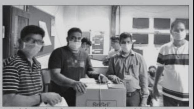
→ कोरोनाविरोधातील लढ्यात अग्रेसर असलेले सिप्ला कंपनीचे कर्मचारी.

सिप्ला लिमिटेडने गोव्यामधील कोविड-१९ महामारीचा सामना करण्यासाठी हाती घेतलेल्या अनेक उपक्रमांची घोषणा केली. कंपनीने नुकतेच संकटाचा सामना करण्यासाठी देशाला आवश्यक असलेल्या विविध त्वरित व दीर्घकालीन बचावकार्यांसाठी २५ कोटी रूपयांचा 'केअरिंग फॉर लाइफ' कोविड-१९ समर्पित फंड उभारला. गोव्यामध्ये कंपनी सरकारच्या कोविड-१९ व्यवस्थापन प्रयत्नांना साह्य करण्यासाठी स्थानिक प्रशासनासोबत सहयोगाने काम करत आहे. सिप्लाचे उपक्रम प्रामुख्याने त्यांचे कर्मचारी, विक्रेते, कंत्राटदार कर्मचारी, प्रत्यक्ष आघाडीवर काम करणारे प्रशासन व आरोग्यसेवा कर्मचारी, तसेच मूलभूत गरजा कमी प्रमाणात उपलब्ध होणाऱ्या समुदायाच्या व्यक्तींवर प्रामुख्याने लक्ष केंद्रित करत आहेत.